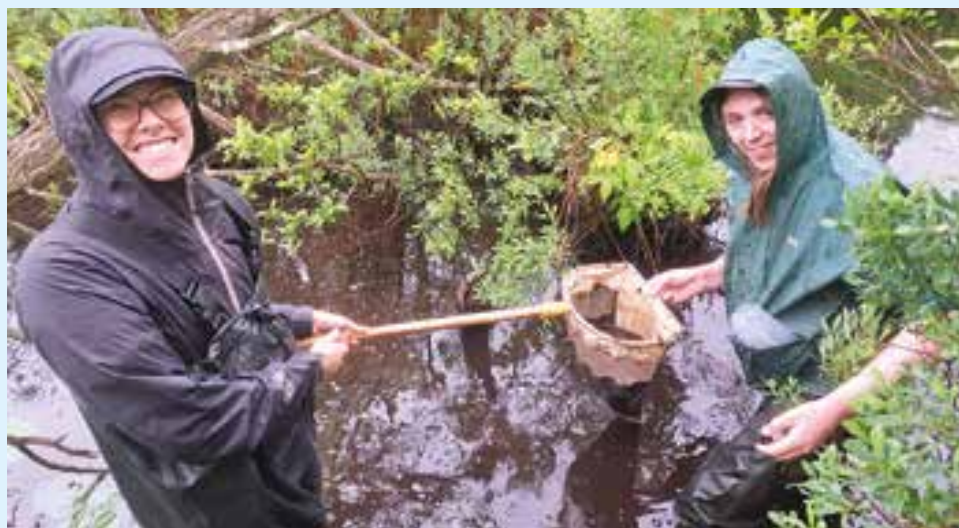
Échantillonnage des tributaires du lac Waterloo avec l'OBV Yamaska