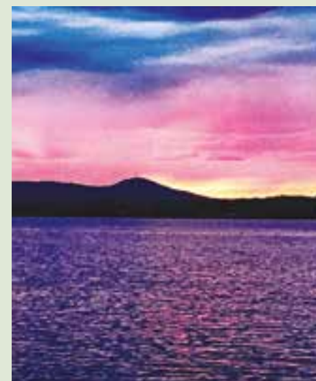
«Couché du soleil sur le lac Waterloo», vue sur le Mont Shefford