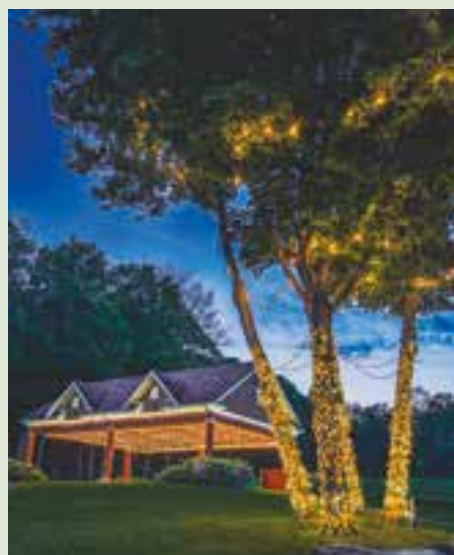
«Après la foule» - photo de Patricia Fournel, au parc de la Mairie