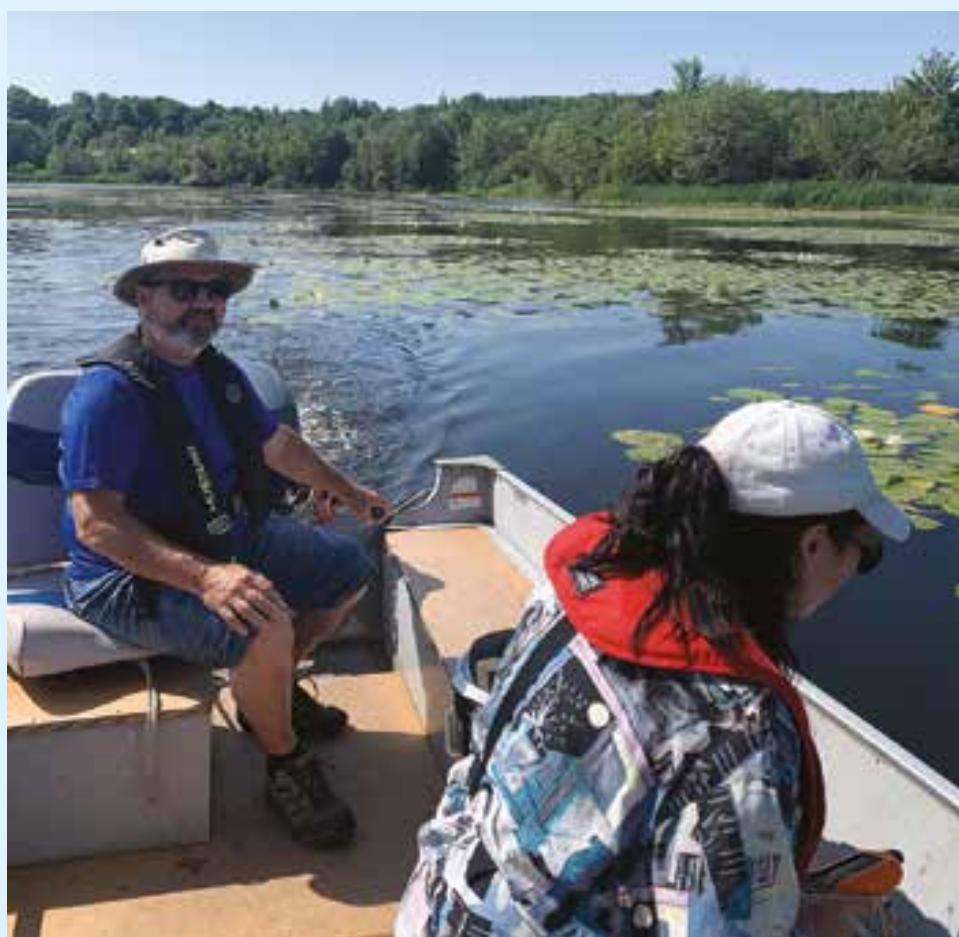
Suivi des plantes aquatiques exotiques envahissantes avec la firme Biodiversité conseil