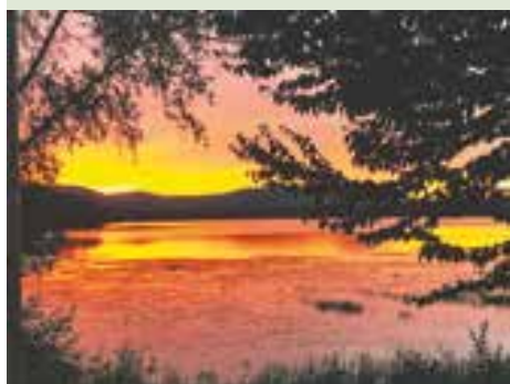
«In the mist» - photo de Manon Gauthier, vue sur le Mont Shefford

Parmi toutes les participations, voici six photos inspirantes qui mettent en lumière la beauté, la vitalité et la richesse de notre milieu de vie.