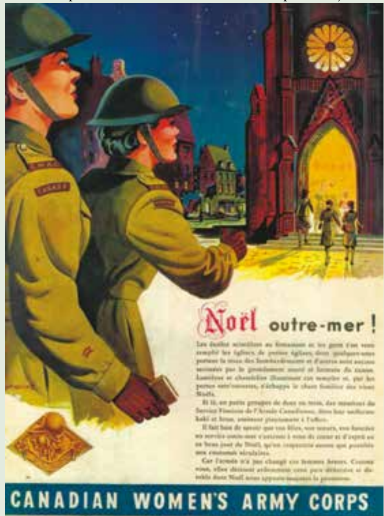
Une publicité parue dans La Revue Populaire rend hommage aux femmes dans l'armée, en décembre 1944.