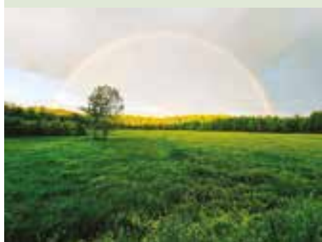
«Après la pluie»