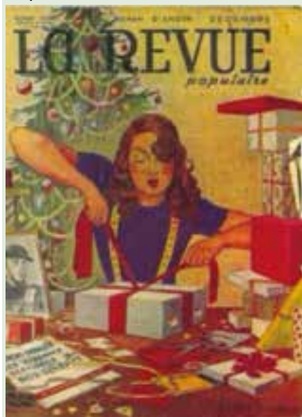
Comment emballer les étrennes destinées à nos soldats » La Revue Populaire, décembre 1942.