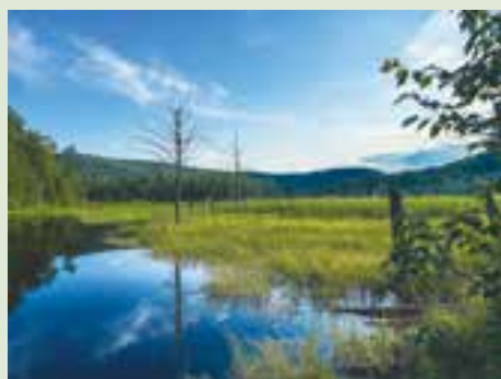
«Quiétude», prise au parc Jean-Paul Forand