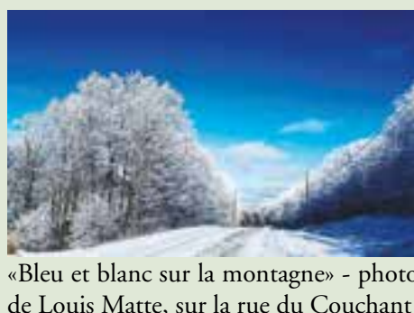
«Bleu et blanc sur la montagne» - sur la rue du Couchant